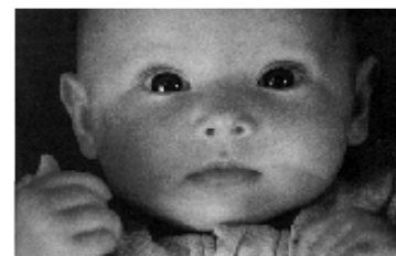
L'un des 7042 citoyens carnussiens ...

Le Cercle Progressiste publie régulièrement des Lettres d'informations auprès de ses adhérents et organise des conférences publiques.